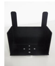
Cat. No. 224-911 保護ポーチ